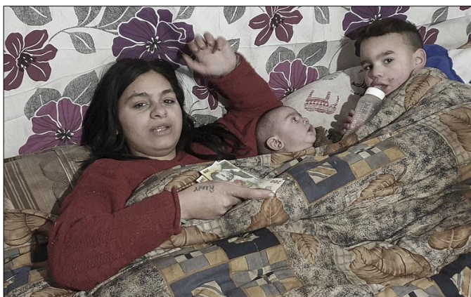
Zonder kachel is het overdag vooral in bed warm.

Net als veel andere landen ontkomt ook Roemenië dit jaar niet aan een snel stijgende inflatie. Eind september was sprake van een inflatie van 15,9% op jaarbasis. Oorzaak van deze stijging ligt voornamelijk in de stijgende prijzen voor olie, gas en elektriciteit, maar ook de voedselprijzen liggen aanzienlijk hoger (+19,2%) dan een jaar geleden. Zo is plantaardige olie inmiddels 47% duurder dan een jaar geleden en tarwebloem 34%. De verwachting is dat aan de hoge inflatiecijfers voorlopig nog geen einde komt. Economen voorspellen dat de piek rond het einde van dit jaar zal liggen. Ook voor volgend jaar wordt rekening gehouden met een hoger dan gemiddelde inflatie.