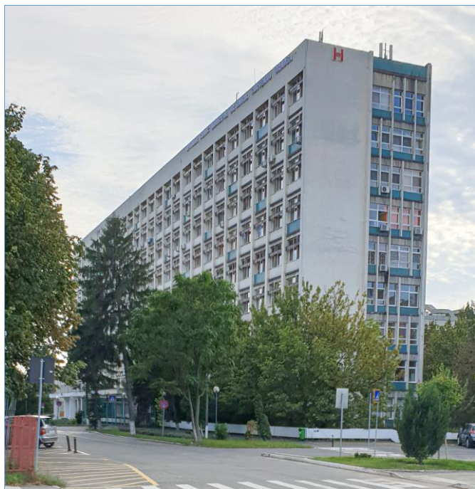
City Hospital, Oradea

Op het moment dat we deze brief schrijven is er een sterke stijging van het aantal Corona patiënten in Roemenië. Oradea is een stad van 620,000 inwoners. Een van de grootste ziekenhuizen (City Hospital) is geheel ingericht voor Corona patiënten. Alle bedden incl. IC zijn momenteel bezet.