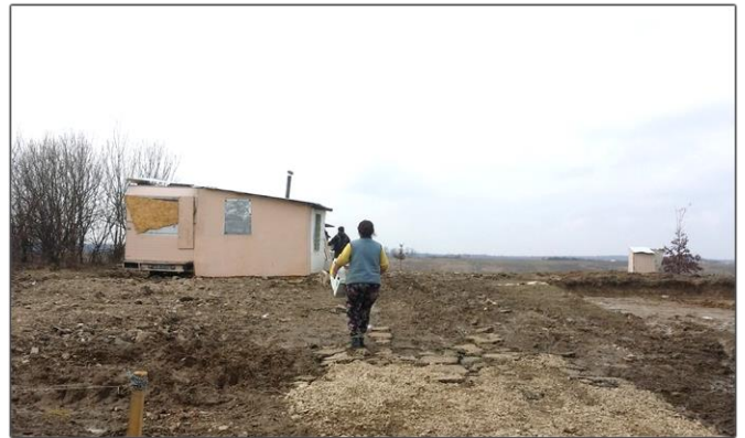
Wonen in een camper+schuurtje valt echt niet mee..

Een ander gezin in ons sponsorprogramma overkwam hetzelfde lot. Nadat hun huisje vernietigd was, verbleven zij steeds weer in andere (tijdelijke) onderkomens. Uiteindelijk zijn ze in een oude camper getrokken met daaraan een schuurtje gebouwd (zie foto). Zij overleven zo onder moeilijke omstandigheden zonder elektra en stromend water. Met name in de afgelopen winter is dit dramatisch geweest. We proberen ook voor deze mensen een oplossing te vinden maar dat valt niet mee omdat daar toch al gauw weer 10,000 euro voor nodig is.