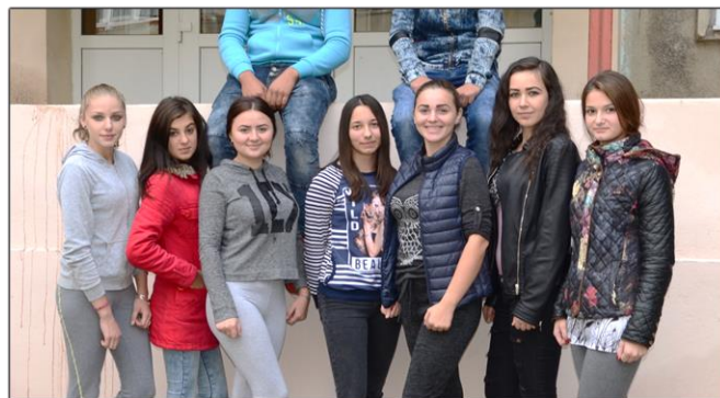
Studenten selectie: een verantwoordelijke taak!