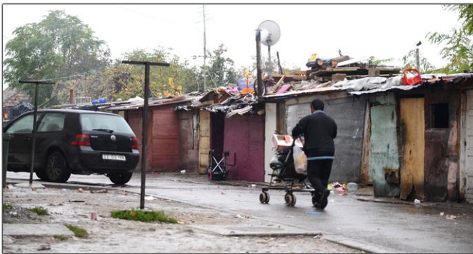
Het schurencomplex voor (boven) en na (beneden)