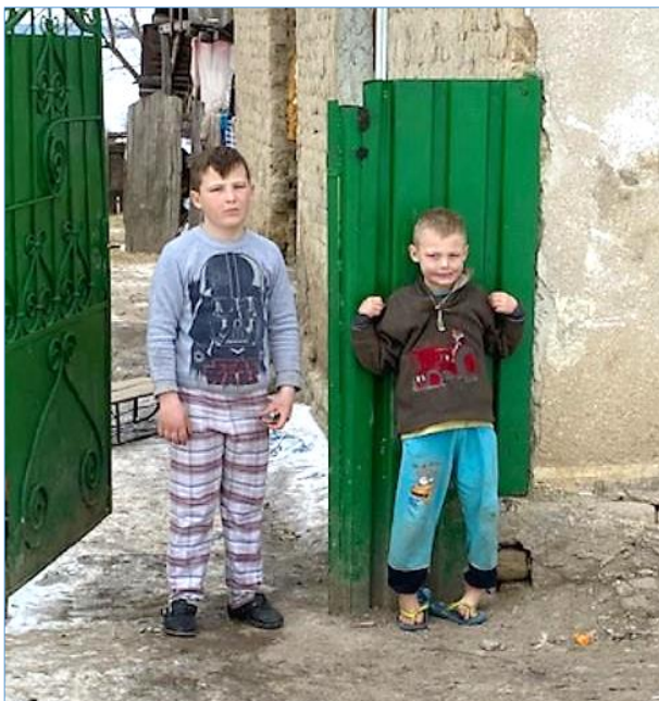
Op teenslippers in de winterse kou

Zoals elk jaar zijn ook dit jaar weer schoenen verstrekt aan de kinderen van de gesponsorde gezinnen. Dat dit geen overbodige luxe is mag blijken uit de bovenstaande foto.