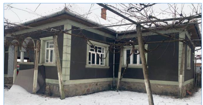
Van de oude woonsituatie naar een echt huis!