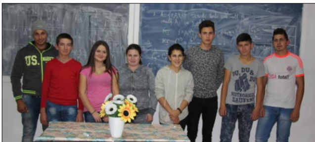
Een aantal van onze studenten ..

Net als in Nederland zijn de scholen in Roemenië bezig met de laatste lesprogramma's voor de zomervakantie. Voor zes van de 66 sponsorstudenten betekent dit een extra spannende tijd omdat zij bezig zijn met de afronding van hun opleiding. Dit betekent ook dat zij moeten nadenken over hun verdere toekomst. Gaan ze aan het werk of willen ze nog een vervolgopleiding doen? Daar waar mogelijk worden deze studenten door onze medewerkers in Roemenië met raad en daad bijgestaan.