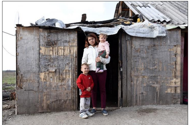
Een kandidaat sponsorgezin

In deze regio hebben we 7 gezinnen bezocht. Veel gezinnen hebben geen inkomen (vader heeft geen opleiding) en de situatie is vaak zorgelijk omdat het leven van een gezin met weinig eten, geen goede kachel en een aanzienlijk aantal kinderen moeilijk is. Ook komen we steeds situaties tegen waar ziekte is. De medische kosten maakt het nog meer onmogelijk voor deze mensen om een redelijk bestaan op te bouwen. Tijdens onze bezoeken hebben de medewerkers gegevens opgenomen die gebruikt worden om te beoordelen of sponsoring gestart kan worden en voor welk bedrag per maand.