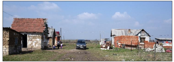
Tirian, het nieuwe sponsorgebied voor FSR