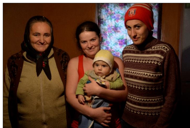
Dit gezin lukt het maar niet uit de armoede te komen!

Bij een van de gezinnen die we al sinds 2000 ondersteunen is de man psychisch niet in orde waardoor hij niet kan werken terwijl hij wel medicijnen nodig heeft. Overdag ligt hij in bed, en 's nachts zet hij zijn kleine huisje op stelten. Zijn vrouw stond daarom al de jaren alleen voor de opvoeding van de kinderen en heeft (mede door de slechte nachtrust) een zwaar leven achter de rug. Gelukkig konden we helpen met de medicijnkosten, kleding en voedselpakketten. Ook konden de kinderen door onze ondersteuning een opleiding volgen. Daarnaast hebben we geholpen om het 'huis' in enigszins bewoonbare staat te houden door o.a. het leveren van een nieuwe kachel.