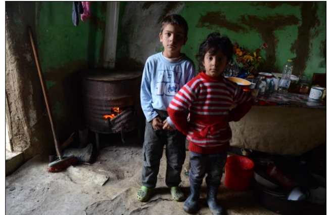
Stookhout en kachels zijn niet weg te denken ..

eigen zeggen zijn ze blij dat ze op deze manier iets terug kunnen doen voor onze organisatie. Een van de mooiste- en indrukwekkendste activiteiten vindt altijd aan het eind van het kamp plaats, namelijk het schrijven van een mooie tekst of wens voor één van de andere kinderen of leiding. Alle kinderen zijn daar serieus mee bezig en ze zijn altijd benieuwd naar wat de andere kampers over hen opschrijven.